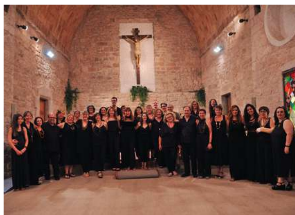
Esclat Gospel Singers